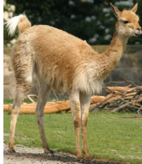
název: lama vikuňa