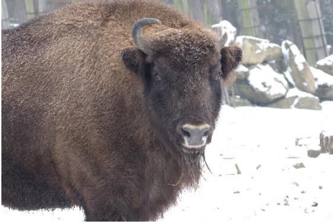
název: zubr evropský