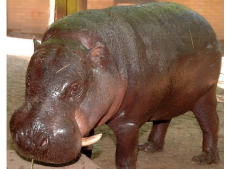
název: hrošík liberijský

ÚKOL 5) Rozhodni, která z vyobrazených kůží patří žirafě síťované, žirafě Rothschildově, zebře Grévyho a zebře Chapmanově. Do vět doplň chybějící pojmy.